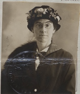
Signature du Porteur.